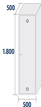
AL-1 COD: 42000