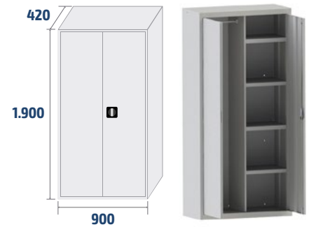
ARM03 COD: 19003