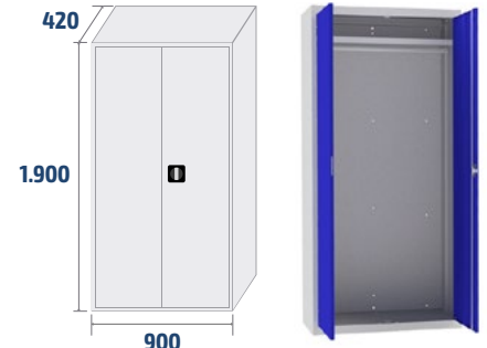
ARM09 COD: 19009