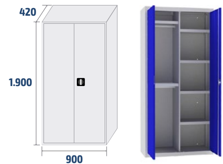
ARM06 COD: 19006