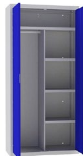
ARM08 COD: 19008