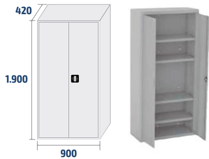
ARM01 COD: 19001