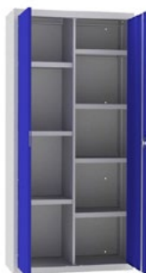
ARM07 COD: 19007