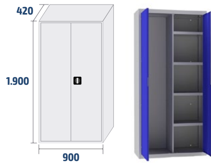
ARM02 COD: 19002